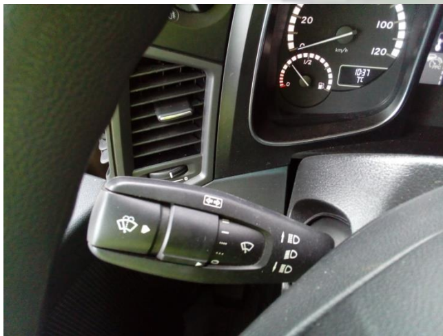
Lichthupe: Hebel zum Lenkrad ziehen