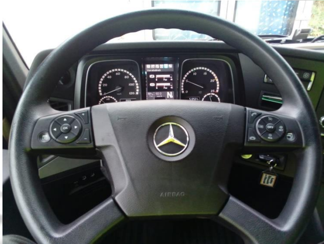
Hupe: Zündung an, Mitte vom Lenkrad drücken